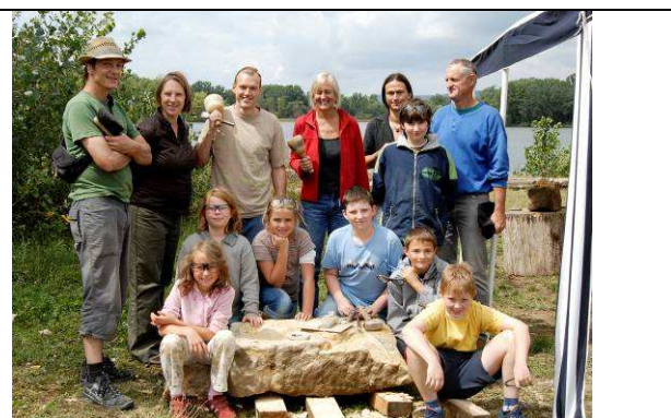
Künstlerinnen und Künstler 2008