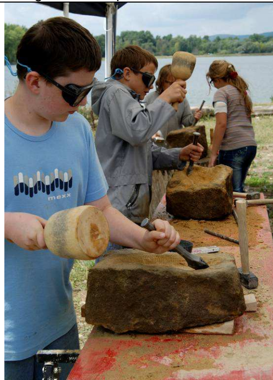
Teilnehmer des Workshops