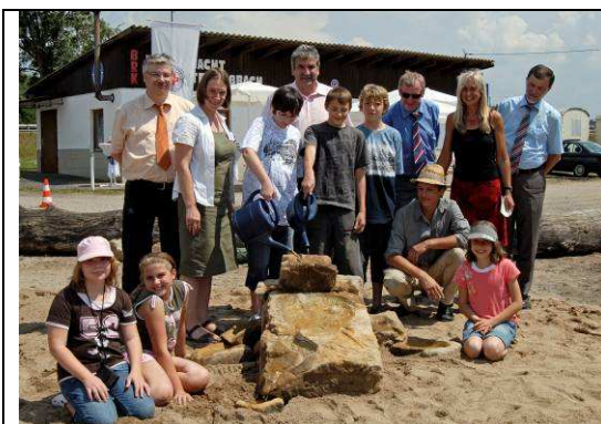
Aufstellung des Steins 2009